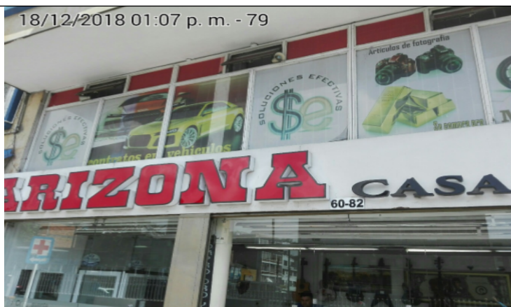
Fotografía panorámica del establecimiento de comercio CASA COMERCIAL SOLUCIONES EFECTIVAS ARIZONA, donde se evidencia los incumplimientos anteriormente descritos.